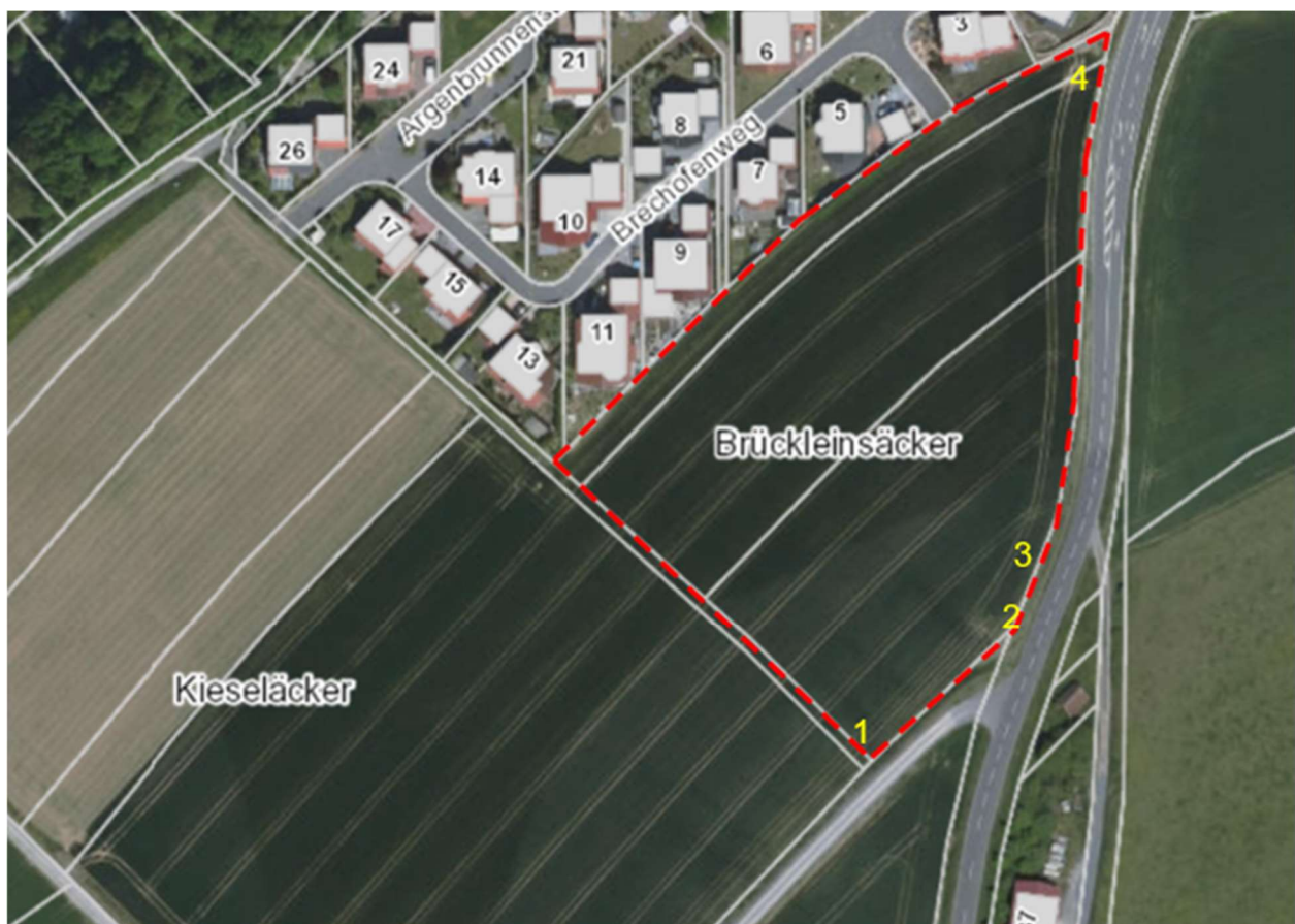
Luftbild mit Planungsgebiet. Die Nummerierung entspricht der Fotodokumentation.