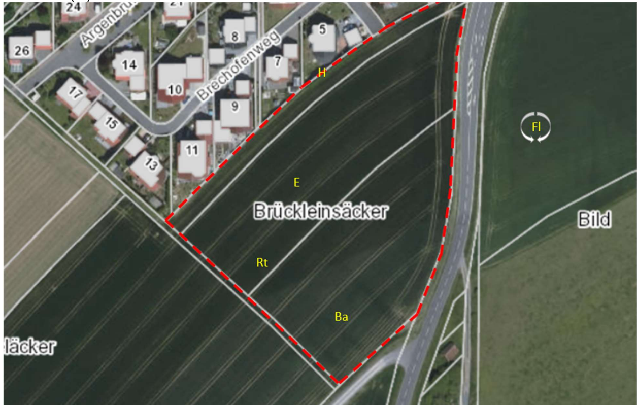
Avifauna, Erhebung am 19.04.2021 Bachstelze (Ba); Elster (E); Feldlerche (Fl); Haussperling (H); Ringeltaube (Rt)