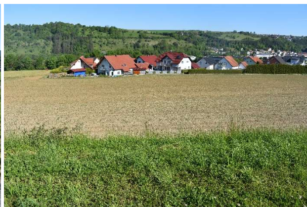
2) Planungsgebiet westliche Grenze