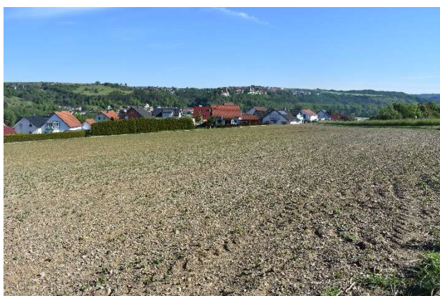
5) Blick Richtung nordöstl. Grenze