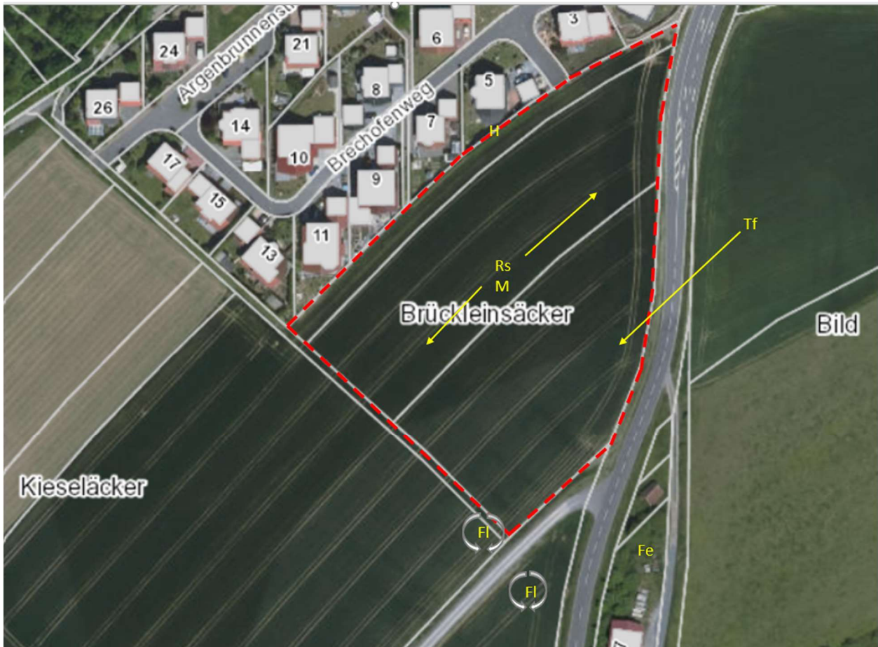
Avifauna, Erhebung am 21.06.2021

Feldlerche (Fl); Feldsperling (Fe); Haussperling (H); Mehlschwalbe (M); Rauchschwalbe (Rs); Turmfalke (Tf)