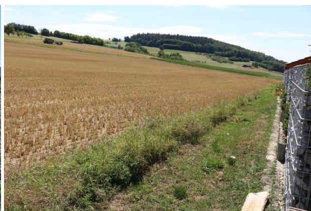
6) Planungsgebiet nördliche Grenze, Richtung Westen

Das Plangebiet besteht aktuell aus einer landwirtschaftlichen Nutzfläche mit Anbau von Sojagetreide. Nördlich wird das Gebiet durch die bestehende Bebauung begrenzt, am Ortsrand befinden sich Zäune und natürliche Hecken zur Abgrenzung und Eingrünung. Südlich verläuft die Kreisstraße K2316 aus in Richtung Eberstal. Die Fläche wird homogen genutzt und schließt in Ortsrandlage an weitere Ackerbauflächen an. Südlich befindet sich noch eine landwirtschaftlich genutzte Halle mit kleinem Streuobstbestand.