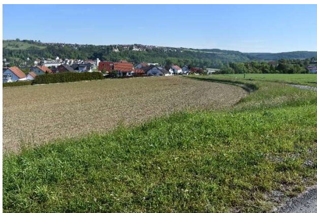
1) Planungsgebiet südöstliche Grenze, 19.04.2021