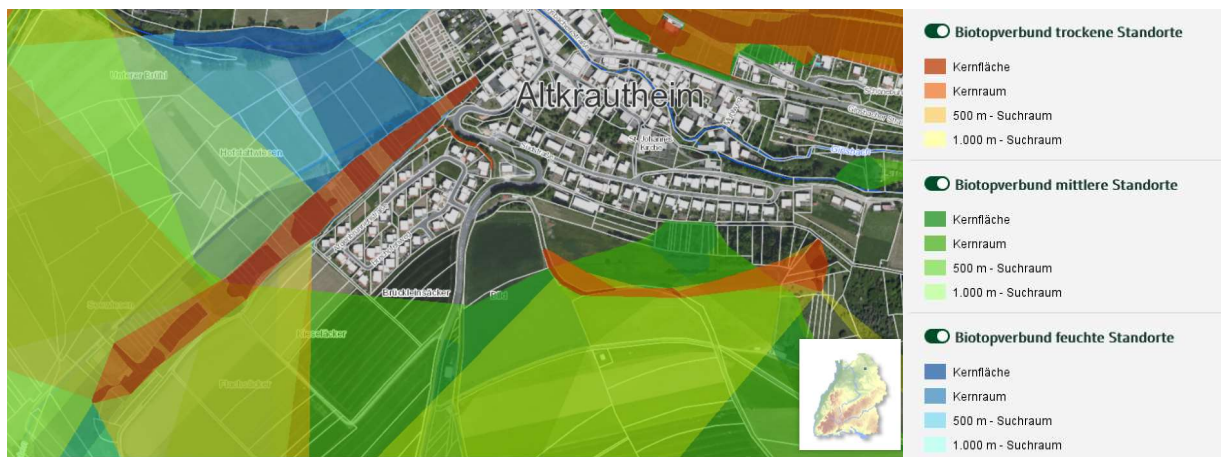
Abbildung: Biotopverbund im Kontext des Plangebietes

Das Plangebiet weist keine schutzwürdigen Flächen per Definition aus. Südlich der Fläche und nördlich der bereits bestehenden Bebauung schließt das Landschaftsschutzgebiet „Jagsttal mit Nebentälern und angrenzenden Gebieten zwischen Kreisgrenze Schwäbisch Hall und Gemeindegrenze Krautheim/Schöntal an. Südlich befindet sich zudem eine FFH Mähwiese, als Viehweide genutzte mäßig artenreiche Trespen-Glatthaferwiese mit ausgewogenem Gras-Kraut-Verhältnis. Nördlich der Bebauung befindet sich zudem das FFH Gebiet Jagsttal Dörzbach-Krautheim 9 „Höhlen, Jagst u. Seitenbäche mit langen naturnahen Abschnitten, ausgedehnte südexpon. Trockenhänge, herrliche Steinriegellandschaften, großfläch. Laubwälder an Nordhängen u. auf der Hochfläche.