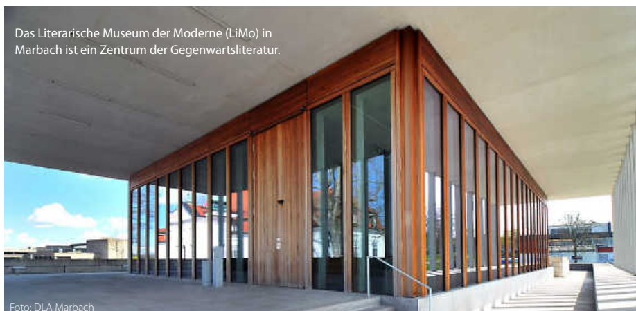
Das Literarische Museum der Moderne (LiMo) in Marbach ist ein Zentrum der Gegenwartsliteratur.

Ob Klassiker oder Bestseller, historische Manuskripte oder Poetry-Slams – Baden-Württemberg zeigt, dass Literatur hier nicht nur geschrieben, sondern gelebt wird. (jr)