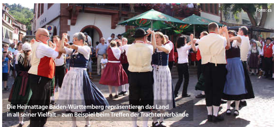
Die Heimattage Baden-Württemberg repräsentieren das Land in all seiner Vielfalt – zum Beispiel beim Treffen der Trachtenverbände