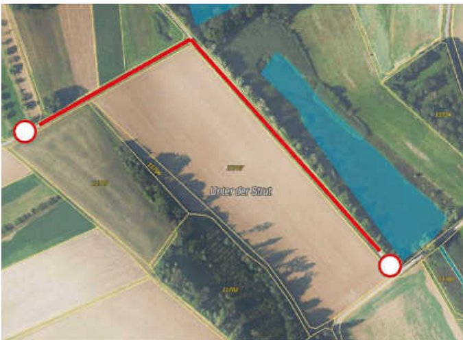
Unter der Strut