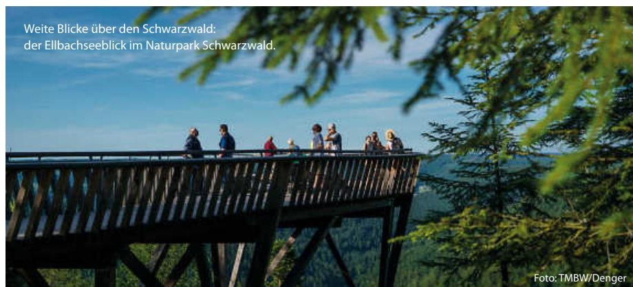
Weite Blicke über den Schwarzwald: der Ellbachseeblick im Naturpark Schwarzwald.

Schon von Weitem ist der Aussichtsturm im Naturpark Schönbuch zu sehen. Die 35 Meter hohe Holz-Stahl-Konstruktion auf dem Stellberg ragt weit über die umliegenden Bäume im ältesten Naturpark Baden-Württembergs hinaus. 348 Stufen erschließen den filigranen Turm und führen zu drei Aussichtsplattformen in 10, 20 und 30 Metern Höhe. Ganz oben kann man nicht nur dem Schönbuch auf sein Blätterdach schauen; auch die Schwäbische Alb und der Schwarzwald erscheinen von hier zum Greifen nah. (TMBW/red)