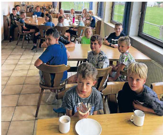
Die Kinder beim Frühstück