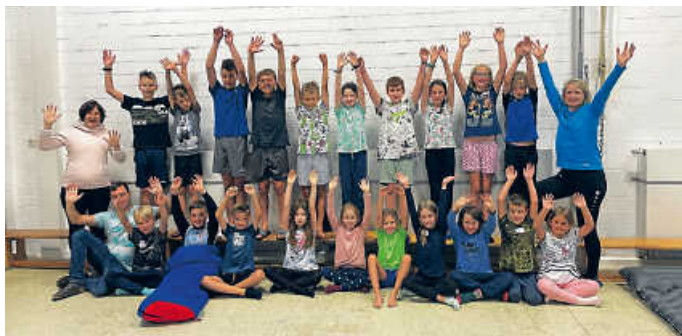
Gemeinschaftsfoto am nächsten Morgen

Am Freitag, 28. Juli 2023 trafen sich um 18.30 Uhr 22 Kinder im Alter von 8 bis 13 Jahren beim SC Klepsau zur Spiel- und Lesenacht. Nach der Begrüßung und Kurzvorstellung war eine Wanderung nach Laibach auf den Spielplatz geplant, aber hier hat der Wettergott leider nicht mitgespielt, sodass die Kinder gleich mit ihren eigenen Spielwünschen starteten. Neben verschiedenen Gesellschaftsspielen wurden auch aktive Gemeinschaftsspiele gespielt wie Mord im Dunkeln, Vampir und Sonne, Räuber im Museum, Ballspiele, Sackhüpfen usw. Da der Regen gegen später nachließ, wurde kurzerhand noch eine Nachtwanderung über die Weinberge nach Dörzbach unternommen. Zum Glück hatten alle ihre Taschenlampe eingepackt. Danach durften die Kinder mit neuer Energie in der Halle weiterspielen bis tief in die Nacht. Die einen schliefen früher, die anderen später. Die ganz starken Kids durften sogar noch im Schlafsack mit einer Taschenlampe lesen. Nach dem gemeinsamen Frühstück im Sportheim am Samstagmorgen und den Erzählungen der gemeinsamen Erlebnisse, wurden die Kinder um 9.30 Uhr von ihren Eltern wieder abgeholt. Es war trotz Regen eine tolle Nacht beim SC Klepsau.