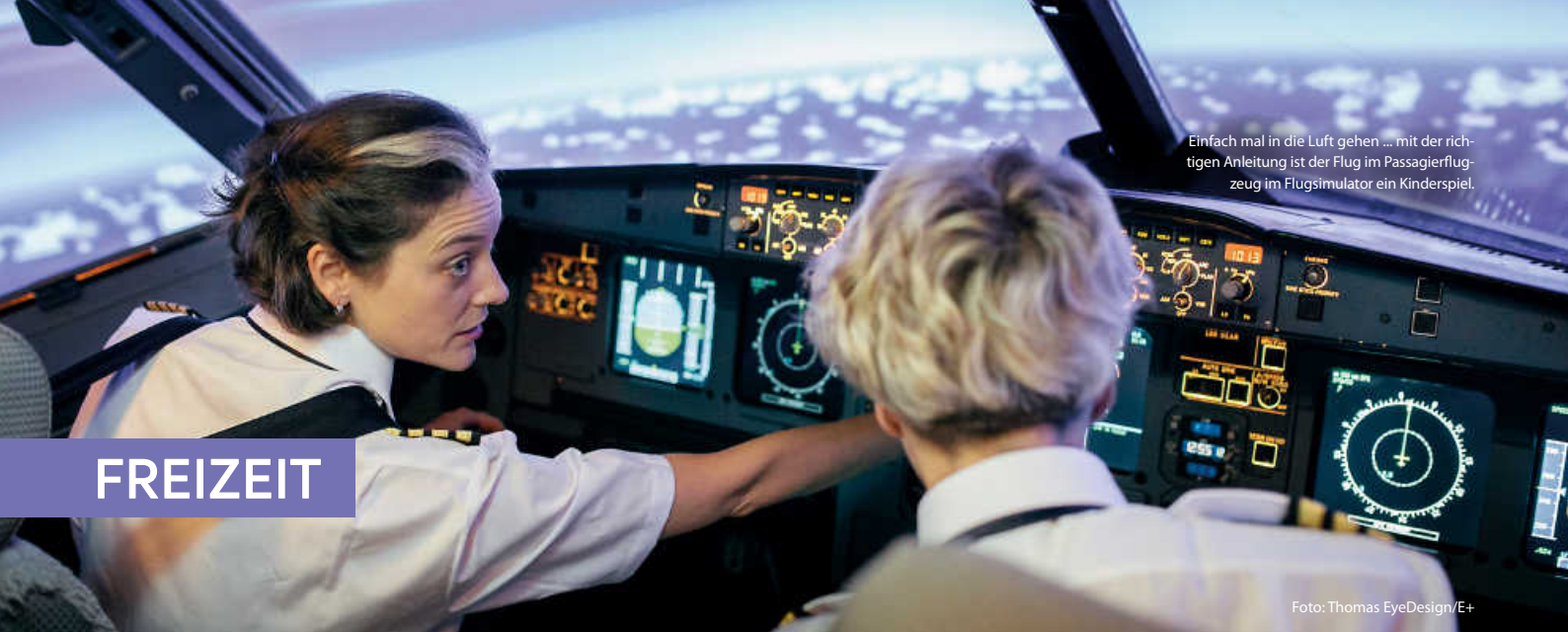
Einfach mal in die Luft gehen ... mit der richtigen Anleitung ist der Flug im Passagierflugzeug im Flugsimulator ein Kinderspiel.