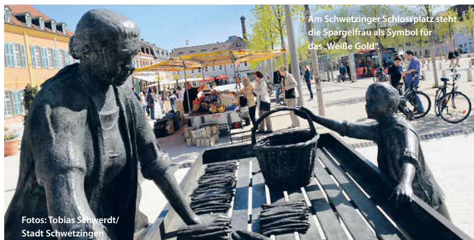
Am Schwetzingener Schlossplatz steht die Spargelfrau als Symbol für das „Weiße Gold“.

In den Städten und Gemeinden entlang der Route laden kleine Museen ein, in die jeweilige Lokalgeschichte einzutauchen. Thematisiert wird dort zum Teil auch die Historie des Spargelanbaus, zum Beispiel im Römermuseum Stettfeld. Größere und kleinere Events und kulinarische Feste rund um die weißen Stangen in der Orten der Spargelstraße, wie beispielsweise der Walldorfer Spargelmarkt, laden zum Schlemmen und Genießen ein. (dyh/jr)