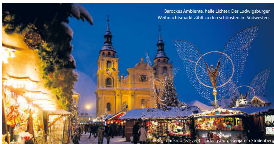
Barockes Ambiente, helle Lichter: Der Ludwigsburger Weihnachtsmarkt zählt zu den schönsten im Südwesten.