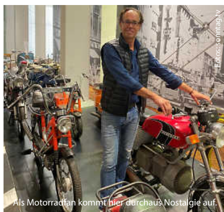
Als Motorradfan kommt hier durchaus Nostalgie auf.