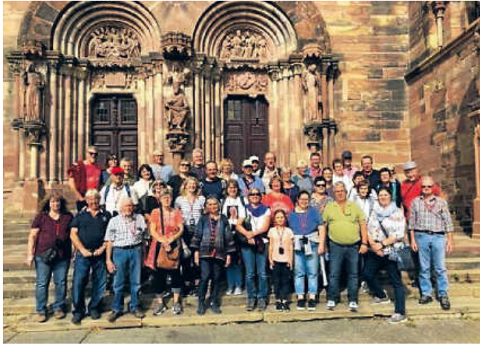
Die Gruppe vor dem Straßburger Münster

Weiter nach Colmar, wo man sich mit seinen Fachwerk- und Renaissancehäusern und den zauberhaft geschmückten Gassen wie in einem Bilderbuch fühlte. Um 16.00 Uhr hieß es Abschied nehmen vom schönen Elsass in Richtung Heimat. In der Küferschenke Sinsheim ließ man den schönen Ausflug ausklingen, ehe man gegen 22.00 Uhr zurück in Oberginsbach war.