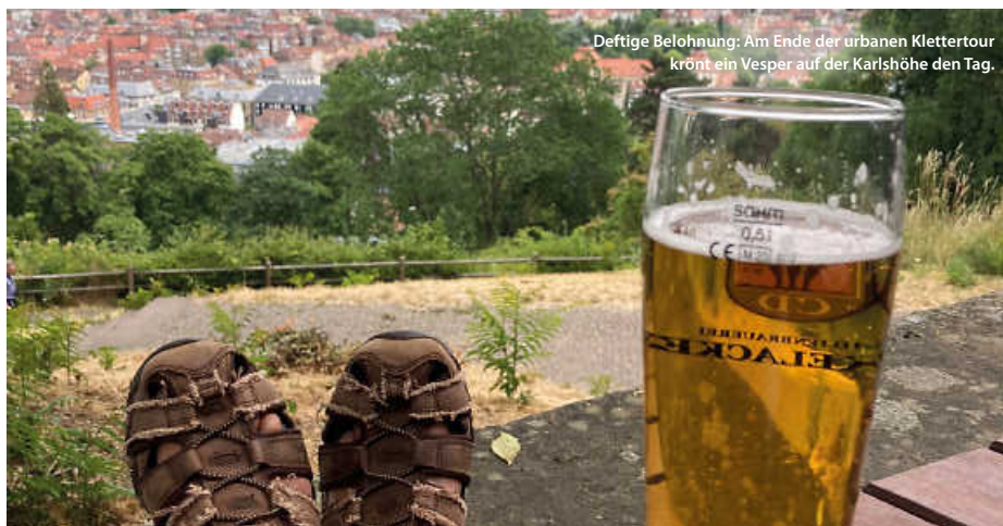
Deftige Belohnung: Am Ende der urbanen Klettertour krönt ein Vesper auf der Karlshöhe den Tag.

Eine Wanderung über die Stäffele ist nicht nur eine großartige Möglichkeit, die Stadt aus ganz neuen Blickwinkeln zu entdecken, sondern auch eine gute Möglichkeit, fit zu bleiben. Aber keine Sorge, die Anstrengung lohnt sich! Am Ende kann man in einem der vielen charmanten Cafés oder Biergärten entspannen und eine Brotzeit oder die Highlights der schwäbischen Küche genießen. Also nichts wie die Laufschuhe geschnürt und bereitmachen zum Aufstieg. Bewegung, Wissenswertes und am Ende ein toller Ausblick warten. (jr)