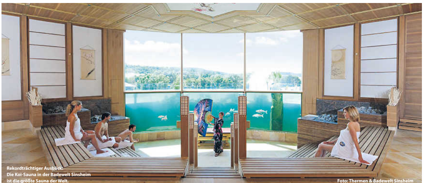
Rekordträchtiger Ausblick: Die Koi-Sauna in der Badewelt Sinsheim ist die größte Sauna der Welt.