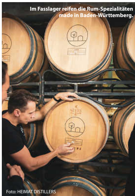
Im Fasslager reifen die Rum-Spezialitäten made in Baden-Württemberg.

Trotz des Erfolges bleiben die Heimat Distillers demütig. „Wir sind sehr dankbar für alles. Wir haben von Anfang an einfach das gemacht, worauf wir Lust hatten, Dinge, die zu uns passen“, meint Richter. Das sieht er auch als Erfolgsgeheimnis: „Die Leute suchen vielleicht auch genau diese Authentizität, dass jemand das macht, worauf er Lust hat.“ (haf)