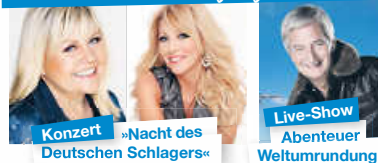
Konzert »Nacht des Deutschen Schlagers«