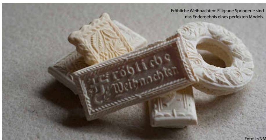
Fröhliche Weihnachten: Filigrane Springerle sind das Endergebnis eines perfekten Modells.

Es zeigt sich also: Die Weihnachtszeit in Baden-Württemberg ist nicht nur von malerischen Landschaften und festlich geschmückten Städten geprägt, sondern auch von einer kulinarischen Vielfalt, die Tradition und Genuss auf wunderbare Weise verbindet. Also nichts wie ans Backbuch, den Ofen, das Nudelholz und die Rührschüssel, und los geht das muntere Weihnachtsbacken. Zeit genug bis zum Fest ist ja noch. (jr)