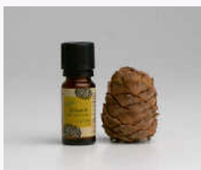
Von Schreinerei Reinhard Reis 10 ml 12,- EUR

wonnen und nicht „gestreckt“. Schwankungen der Inhaltsstoffe, die von der Bodenbeschaffenheit, dem Klima und den Witterungsverhältnissen während des Wachstums und der Erntezeit sowie der Pflanzengattung abhängig sind, werden bei dieser höchsten Qualitätsstufe nicht „nachgebessert“. 100 Prozent naturreine ätherische Öle enthalten daher auch keine biotechnologisch hergestellten Duftstoffe, die laut Gesetz als „natürlich“ bezeichnet werden dürfen. Beim Kauf sollte man darauf achten, dass das Öl naturbelassen ist, möglichst aus zertifiziertem Bio-Anbau stammt und keine synthetischen oder „naturidentischen“ Zusatzstoffe enthält. Bis heute ist es nicht möglich, naturreine ätherische Öle, die teilweise mehrere hundert Substanzen enthalten und deswegen auch als Vielstoffgemische bezeichnet werden, im Labor „nachzubauen“. Es gibt auch standardisierte ätherische Öle nach Arzneibuch. Entspricht ein natürliches ätherisches Öl den dortigen Standards nicht, werden naturidentische oder isolierte Inhaltsstoffe wie Geraniol oder Menthol zugesetzt und es ist kein naturreines Produkt mehr. (ots/PRIMAVE-RA LIFE/red)