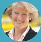
Prof. Monika Grütters

Dazu laden wir mehr als tausend Gäste ein, die sich rund um das Thema Zusammenhalt in der Gesellschaft engagieren – oftmals ehrenamtlich in lokalen Organisationen und Vereinen. Dazu eine ganze Reihe prominenter Speaker, die in Redebeiträgen und Diskussionsrunden verschiedene Teilbereiche beleuchten. Den Tag schließen wir mit einem festlichen Abendkonzert ab.