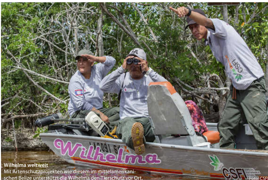
Wilhelma weltweit Mit Artenschutzprojekten wie diesem im mittelamerikanischen Belize unterstützt die Wilhelma den Tierschutz vor Ort.

„Weil man aber das, was man nicht versteht, auch nicht schützen kann“, wie Wüst sagt, legt die Wilhelma großen Wert auf die Bereiche Umweltbildung und Forschung. „Wir wollen, dass unsere Besucher und vor allem die Kinder mit einer größeren Faszination für die Natur, die Botanik und die Tiere unseren Zoo verlassen“, sagt sie und verweist auf die vielen Veranstaltungen und Aktionen, die über das Jahr verteilt stattfinden. Da geht es zum Beispiel einmal um Menschenaffen, ein andermal dreht sich alles um Unterschiede von Reptilien und Amphibien oder auch um tropische Nutzpflanzen. So macht Schule Spaß. (Andreas Kaier)