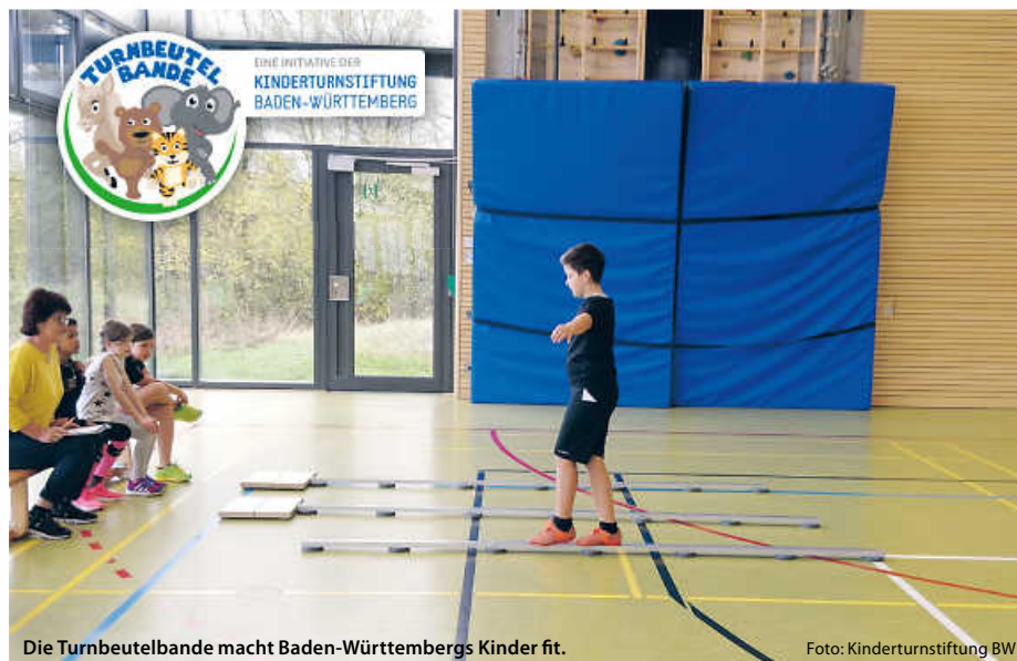
Die Turnbeutelbande macht Baden-Württembergs Kinder fit.

Für die fünf ersten Kommunen, die den Motoriktest für Kinder bei sich durchführen wollen, bietet die Kinderturnstiftung Baden-Württemberg eine kostenlose digitale Schulung an. Im Rahmen der etwa zweistündigen Veranstaltung wird der Test vorgestellt, und es werden Tipps zur erfolgreichen Organisation und Durchführung gegeben. (pm/red)