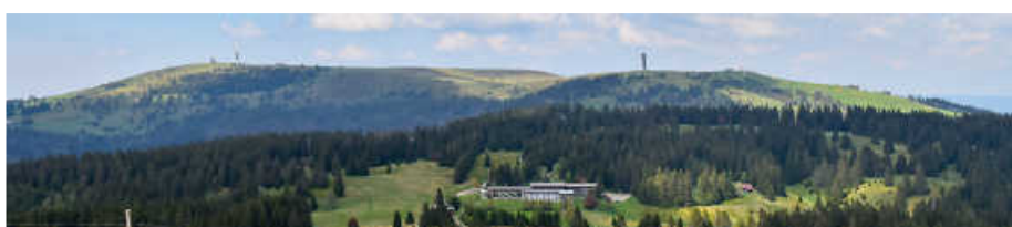
Blick vom Herzogenhorn auf den Feldberg