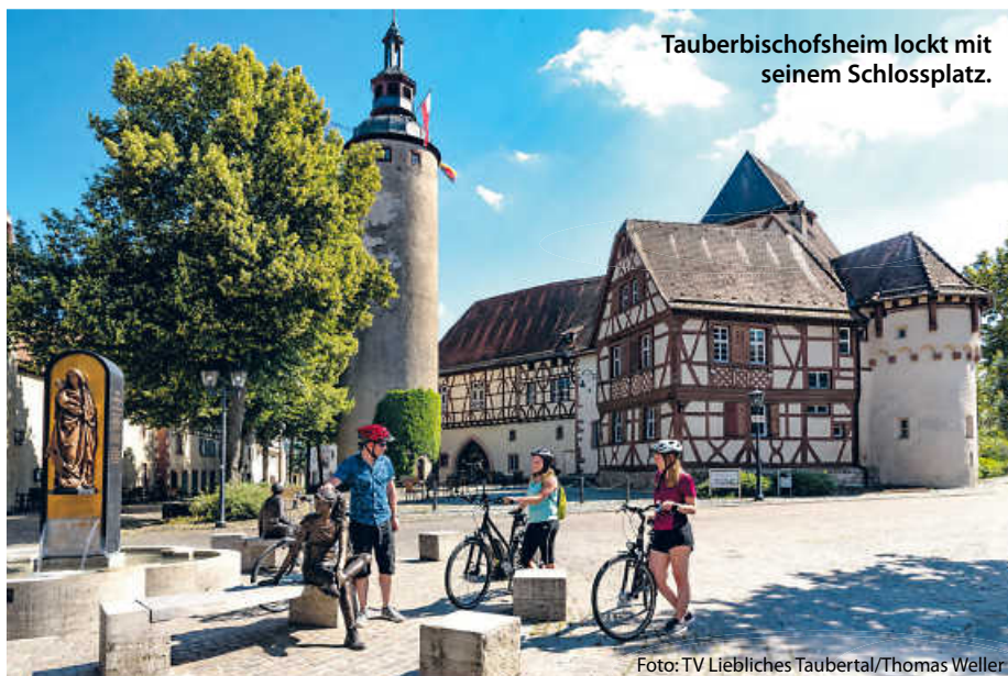
Tauberbischofsheim lockt mit seinem Schlossplatz.

Zahlreiche Freibäder, der Kletterpark in Wertheim sowie der Tierpark Bad Mergentheim bieten vor allem Familien tagesfüllende Ausflugsziele oder lohnende Zwischenstopps an. Die Zeit für kulinarische Pausen kommt dabei nicht zu kurz: nach einem Grünkerngericht als Vorspeise bieten sich Tauberforellen oder ein Taubertäler Lamm an. Neben Weinliebhabern macht das Taubertal auch Freunde des Bieres glücklich; gleich vier Brauereien verteilen sich auf den hundert Kilometern Strecke. Na dann, zum Wohl! (tam)