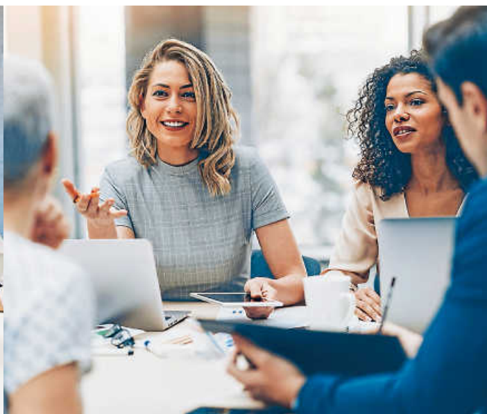
Eine Tätigkeit in einer Führungsposition im öffentlichen Dienst verlangt neben großem Fachwissen auch ein hohes Maß an Teamfähigkeit.