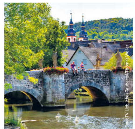
Die Grünbachbrücke in Lauda-Königshofen.