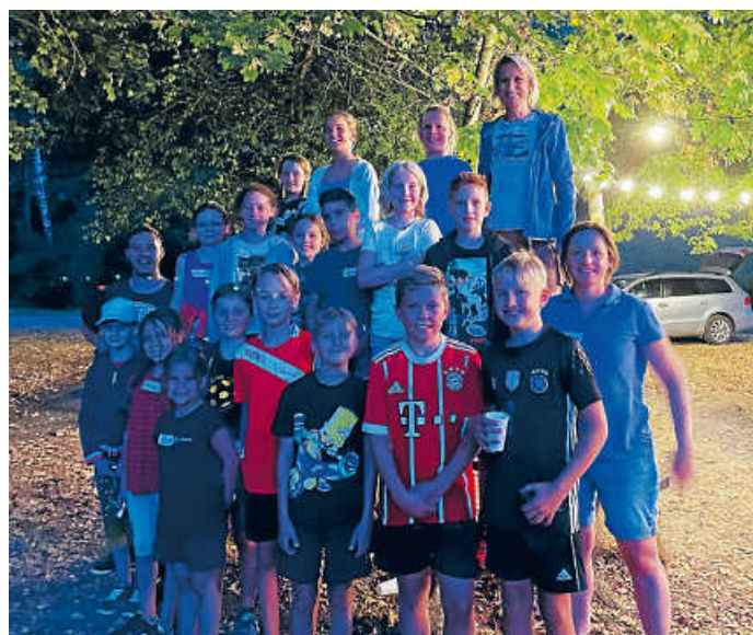
Gemeinschaftsfoto auf dem Laibacher Spielplatz

Am Freitag, 12. August 2022 trafen sich um 18.30 Uhr 18 Kinder im Alter von 8 bis 13 Jahren beim SC Klepsau zur Spiel- und Lesenacht. Nach der Begrüßung und Kurzvorstellung wanderten die Kinder mit den Betreuer:innen zum Laibacher Spielplatz, wo sich neben dem Spielen alle durch ein Vesper und Getränke stärken durften. Um