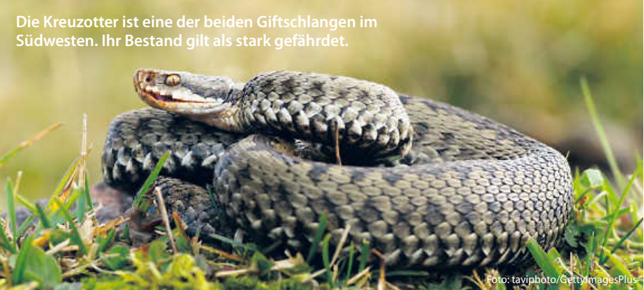
Die Kreuzotter ist eine der beiden Giftschlangen im Südwesten. Ihr Bestand gilt als stark gefährdet.