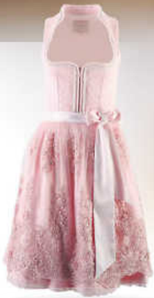
Krüger collection Dirndl – Modell ROSÉ GLOW, inkl. Spitzenschürze, 60 cm 269,00 €*