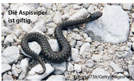
Die Aspispiper ist giftig.