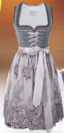
Krüger collection Dirndl – Modell THERESA, inkl. Spitzenschürze, 60 cm 249,00 €*