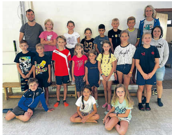
Gemeinschaftsfoto in der Sporthalle Klepsau

21.30 Uhr ging es wieder per Fußmarsch zurück in die Sporthalle Klepsau. Hier durften die Kinder Gesellschaftsspiele spielen, malen, lesen, unterhalten. Es wurden aber auch aktive Gemeinschaftsspiele mit allen gespielt wie „Mord im Dunkeln“, Seil ziehen, usw. Gegen später wurde gespielt/gelesen bis tief in die Nacht. Die ganz munteren Kids durften sogar noch im Schlafsack mit einer Taschenlampe lesen. Nach dem gemeinsamen Frühstück im Sportheim am Samstagmorgen und den Erzählungen der gemeinsamen Erlebnisse wurden die Kinder um 9.30 Uhr von ihren Eltern wieder abgeholt. Es war eine tolle Nacht beim SC Klepsau.