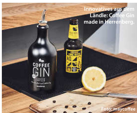
Innovatives aus dem Ländle: Coffee Gin made in Herrenberg.

Inzwischen ist Baden-Württemberg Heimat für preisgekrönte Gins. Egal, ob Boar aus dem Schwarzwald, Ginstr aus der Landeshauptstadt, Hugs aus dem Heilbronner Land oder Senft vom Bodensee. Geschmacksrichtungen gibt es viele: Wacholder-dominierte London Dries, Gins mit starker Zitrus-Komponente, pfeffrige Varianten oder kräuterbasierte Kompositionen – sie alle kann man entdecken. Wer sich auf seinen eigenen Gaumen verlassen und ganz individuell die Welt des Gins made in BW erkunden will – der hat hier wirklich die volle Auswahl.