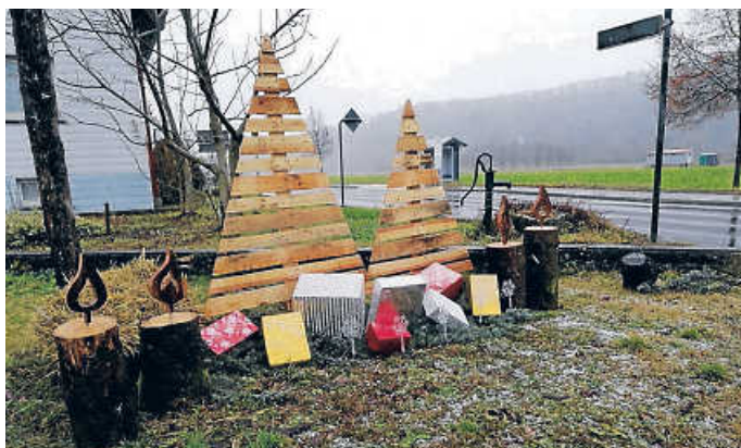
Weihnachtsdekoration in Klepsau