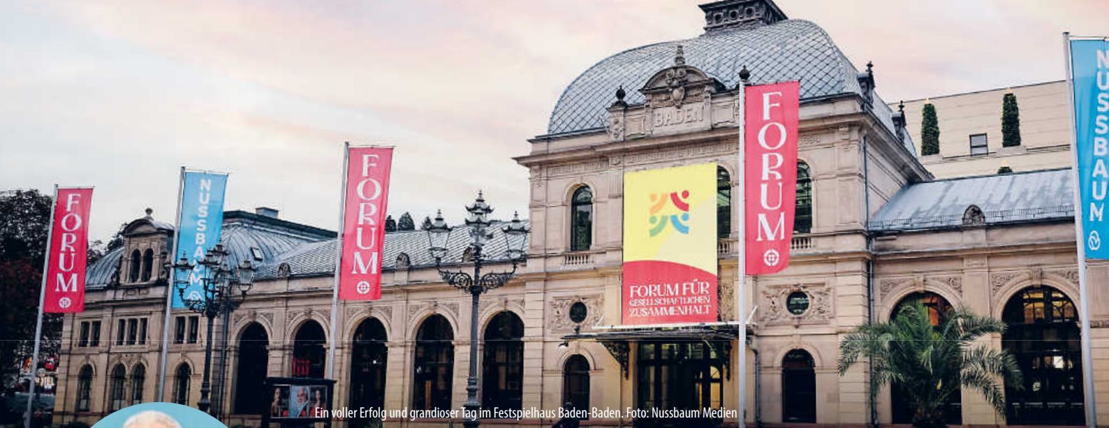
Ein voller Erfolg und grandioser Tag im Festspielhaus Baden-Baden.