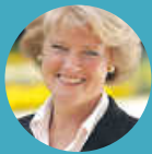
Prof. Monika Grütters

Veranstalter und Inhaber von Nussbaum Medien