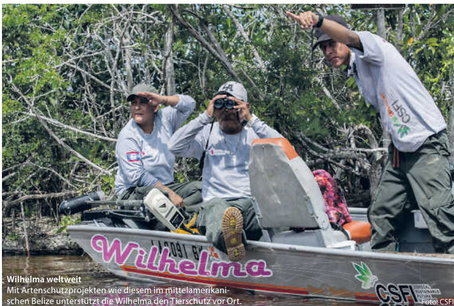
Wilhelma weltweit Mit Artenschutzprojekten wie diesem im mittelamerikanischen Belize unterstützt die Wilhelma den Tierschutz vor Ort.

„Weil man aber das, was man nicht versteht, auch nicht schützen kann“, wie Wüst sagt, legt die Wilhelma großen Wert auf die Bereiche Umweltbildung und Forschung. „Wir wollen, dass unsere Besucher und vor allem die Kinder mit einer größeren Faszination für die Natur, die Botanik und die Tiere unseren Zoo verlassen“, sagt sie und verweist auf die vielen Veranstaltungen und Aktionen, die über das Jahr verteilt stattfinden. Da geht es zum Beispiel einmal um Menschenaffen, ein andermal dreht sich alles um Unterschiede von Reptilien und Amphibien oder auch um tropische Nutzpflanzen. So macht Schule Spaß. (Andreas Kaier)