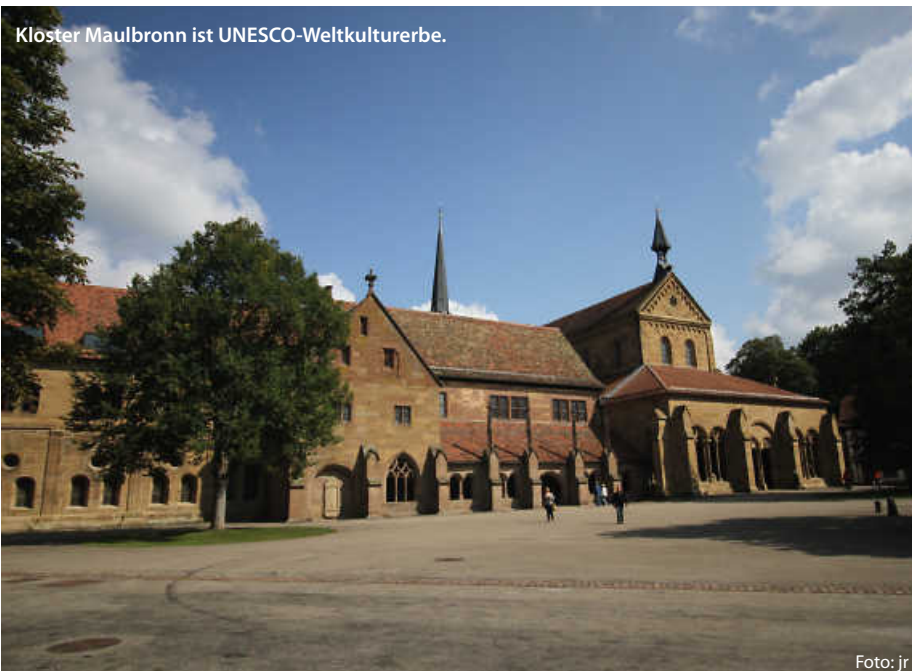
Kloster Maulbronn ist UNESCO-Weltkulturerbe.

https://lokalmatador.net/schloesser-burgen/