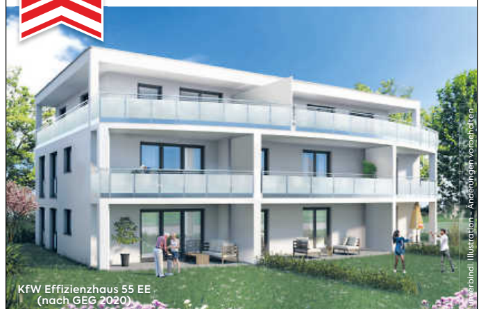
KfW Effizienzhaus 55 EE (nach GEG 2020)

2½- & 3½-Zi-Eigentumswohnungen sowie Penthousewohnungen, attraktive Grundrisse, Terrasse/Balkon/Dachterrasse, Aufzug, Fußbodenheizung, Tiefgarage & vieles mehr! Baubeginn erfolgt.