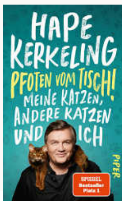
Kerkeling, Hape: Pfoten vom Tisch Piper Verlag, 293 S. EUR 22,-

Wassernapf immer ausreichend gefüllt sein sollte. Auch bei Katzen treten mit den Jahren Verschleißerscheinungen oder gar Verlust der Zähne ein. Wenn die Katze nicht mehr richtig beißen und kauen kann, ist eine Umstellung auf Nahrung mit weicherer Konsistenz erforderlich. Normalerweise ist die Katze auch im hohen Alter ein sehr sauberes Tier. Bei Verhaltensveränderungen wie häufigem Urinieren oder Stuhlgang außerhalb der Katzentoilette sollte daher der Tierarzt konsultiert werden, um organische Krankheiten auszuschließen, ebenso bei Verhaltensveränderungen wie Desorientierung, Demenz oder übermäßiger Reizbarkeit. Ein Gesundheitscheck zweimal im Jahr ist auch wichtig, um andere Krankheiten rechtzeitig zu erkennen und zu behandeln. Denn hat eine Katze Beschwerden, ist dies an ihrem Verhalten oftmals nicht sofort zu erkennen. Extra Zuwendung und Einfühlungsvermögen sowie viele gemeinsame Kuschel- und Spielstunden halten das Tier darüber hinaus nicht nur länger fit und gesund, sondern werden sicherlich auch mit einem freudigen Schnurren gedankt. (IVH/red)