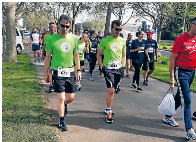
Weg zum Start

Danke an Winobiola aus Brackenheim für das gemeinsame Training vorab und die tollen Anfeuerungen an der Strecke.