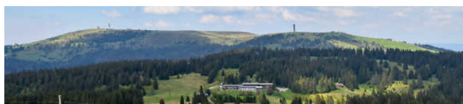
Blick vom Herzogenhorn auf den Feldberg