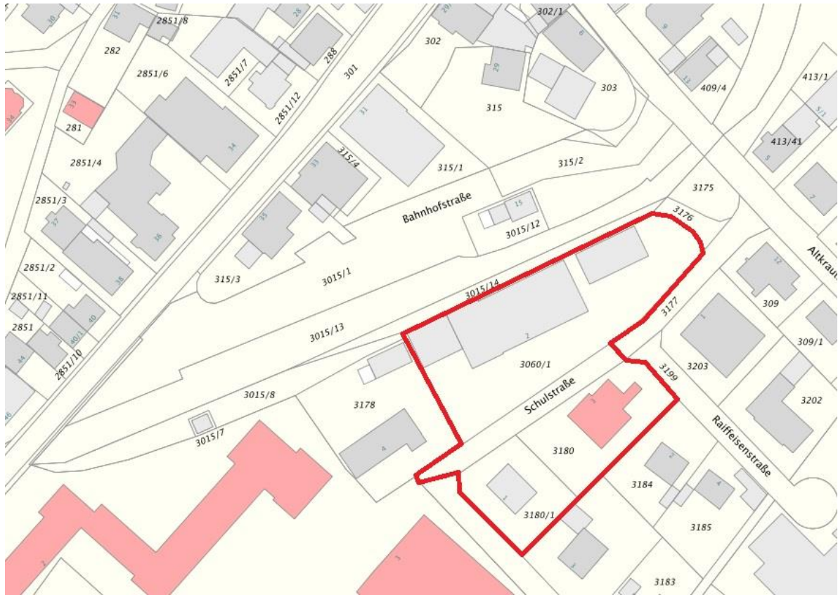
Abbildung 1: Lageplan des Projektgrundstücks